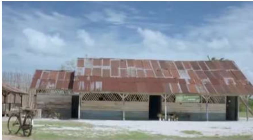
Gambar 2. Kondisi SD Muhammadiyah dalam film Laskar Pelangi

SD Muhammadiyah dalam film menjadi simbol keteguhan, perjuangan, dan harapan dalam memperoleh pendidikan. Secara denotatif, SD Muhammadiyah merupakan sekolah sederhana yang memiliki fasilitas terbatas dan kondisi bangunan yang hampir roboh. Namun, secara konotatif sekolah tersebut melambangkan semangat perjuangan masyarakat miskin dalam mempertahankan pendidikan bagi anak-anak mereka.