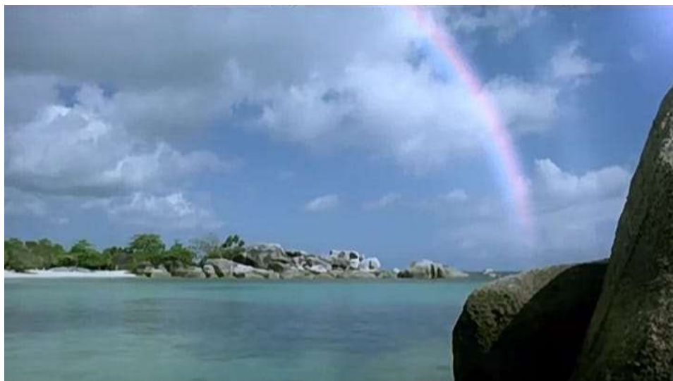
Gambar 4. Pelangi yang menjadi inspirasi nama Laskar Pelangi

Pelangi dalam film menjadi simbol harapan, persahabatan, dan semangat pantang menyerah. Secara denotatif, pelangi merupakan fenomena alam berupa kumpulan warna yang muncul setelah hujan. Namun, secara konotatif pelangi melambangkan cita-cita, mimpi, dan harapan anak-anak Belitung untuk memperoleh kehidupan yang lebih baik. Pelangi digambarkan sebagai sesuatu yang indah dan muncul setelah hujan, sehingga melambangkan harapan setelah menghadapi kesulitan hidup.