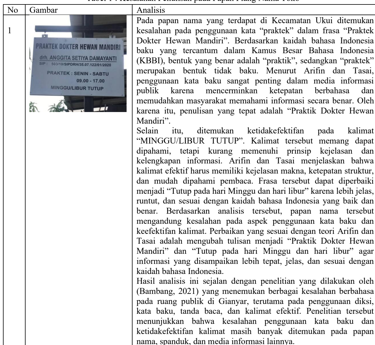
Tabel 1 : Kesalahan Penulisan pada Papan Plang Nama Toko

Pada bagian hasil dan pembahasan ini, peneliti menyajikan beberapa data berupa foto plang nama toko yang mengandung kesalahan penulisan. Setiap data dianalisis berdasarkan kaidah bahasa Indonesia, khususnya yang berkaitan dengan ejaan, diksi, dan penggunaan bentuk baku menurut Kamus Besar Bahasa Indonesia (KBBI) serta Pedoman Umum Ejaan Bahasa Indonesia (PUEBI). Analisis tersebut bertujuan untuk memberikan pemahaman mengenai bentuk kesalahan yang ditemukan sekaligus memberikan perbaikan penulisan yang sesuai dengan kaidah bahasa Indonesia yang baik dan benar.