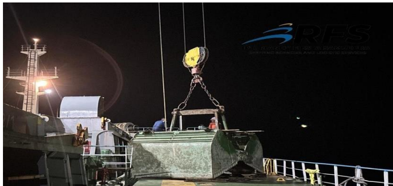
Gambar 4. Proses Pengecekan Crane/Wire

Sebelum kegiatan bongkar muat dilakukan, agent on board dan foreman akan melaksanakan pengecekan crane pada kapal tersebut untuk memastikan kondisi crane kapal dalam keadaan baik dan layak untuk dioperasikan, pengecekan ini dilakukan untuk mengidentifikasi kerusakan alat sebelum dioperasikan agar menghindari kerusakan yang lebih parah pada saat crane dioperasikan, agar kegiatan bongkar muat tidak ada hambatan dan dapat berjalan dengan efektif dan efisien tanpa ada hambatan kerusakan alat bongkar muat.