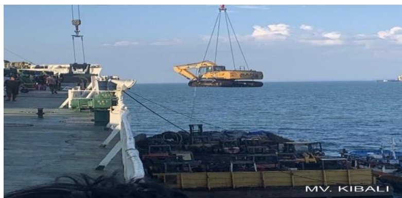
Gambar 3. Proses pemindahan alat bongkar muat

Berdasarkan hasil penelitian yang terjadi secara langsung di lapangan, peneliti banyak menemukan adanya hambatan yang terjadi pada saat kegiatan bongkar muat. Adapun penelitian yang akan di bahas oleh penulis yaitu peranan agen dalam menunjang kegiatan bongkar muat pada PT. Riandy Fiesta Samudera dari hasil analisa penulis, di atas kapal tentang apa – apa saja yang harus di persiapkan. Sebelum kegiatan bongkar muat di kapal yang di ageni PT. Riandy Fiesta Samudera, di nyatakan bahwa adanya beberapa hal yang harus di siapkan sebelum melakukan kegiatan bongkar muat di atas kapal yaitu persiapan stowage plan kapal dengan loading sequence yang akan di sepakati oleh foreman dan chief officer di atas kapal.