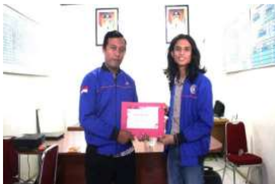
Gambar 4. Pemberian sertifikat untuk pemateri

Gambar 5 di bawah adalah tampilan antarmuka dari laman www.gerabahbumijaya.com , sayang sekali saat diakses tanggal 27 Juli 2024, website ini sudah down. Kemungkinan penyebabnya -sebagaimana sudah disinggung di bagian metode- adalah tidak kompaknya penduduk perajin, khususnya perajin dengan skala besar. Menurut Ahmad Suhaemi, selain dirinya ada juga ada beberapa perajin besar lain. Kemungkinan hasil pengabdian berupa website yang dimiliki bersama oleh para perajin gerabah di Desa Bumijaya, tidak berjalan mulus.