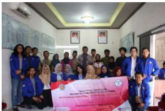
Gambar 3. Berfoto bersama pemateri

Semua luaran yaitu meningkatnya pemahaman akan keterampilan pemasaran digital perajin Bumijaya dan terpublikasinya domain dari website www.gerabahbumijaya.com , berhasil dicapai.