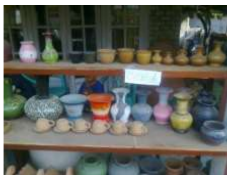
Gambar 2. Produk Gerabah Tradisional

Berdasarkan uraian sebelumnya, tim pengabdian masyarakat berinisiatif untuk melaksanakan penyuluhan pemasaran berbasis digital dengan fokus pada pembuatan website. Penyuluhan pemasaran di desa dapat mengurangi pengangguran (Wibowo, 2024). Meskipun aspek pembukuan juga penting sebagaimana terjadi pada UMKM Kue Satu Desa Magelaran Cilik (Wibowo & Kurnia, 2020), namun saat ini pengabdian kami hanya fokus di pemasaran. Diharapkan melalui pelatihan ini, para pengrajin gerabah dapat memiliki kemampuan untuk memasarkan produknya secara mandiri melalui platform online, sehingga dapat meningkatkan penjualan dan memperluas jaringan pemasaran. Kurang apiknya aspek produksi, lambat laun akan berkurang jika penjualan produk semakin tinggi dengan menjangkau konsumen yang lebih luas.