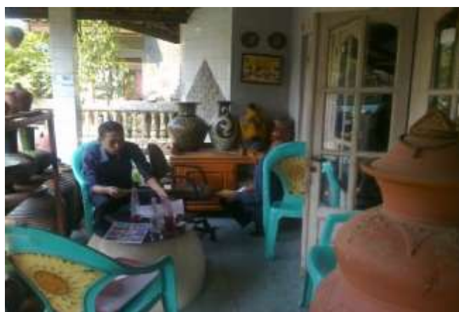
Gambar 1. Petugas mendampingi informan mengisi formulir

menuturkan bahwa pernah juga pengusaha dari Bali membeli bahan mentah tanah liat Desa Bumijaya untuk dibuat di Bali. Nilai tambah yang rendah membuat pemerintah daerah melarang praktik ini. Ditambah dari sisi ekonomi, sebagian besar pengrajin masih bergantung pada pemasaran tradisional yang terbatas jangkauannya. Jika ada pelanggan dari luar negeri, mereka membeli dari pengrajin Bali yang membeli bahan dari Desa Bumijaya (Salakanews.com, 2019) (inforadar.disway.id, 2022). Selain itu, minimnya pengetahuan tentang pemasaran digital membuat produk gerabah kesulitan menembus pasar yang lebih luas. Rendahnya kemampuan produksi dan kreativitas produk juga sebenarnya dialami oleh para penduduk Desa Bumijaya. Dampaknya adalah produk mereka cukup monoton.