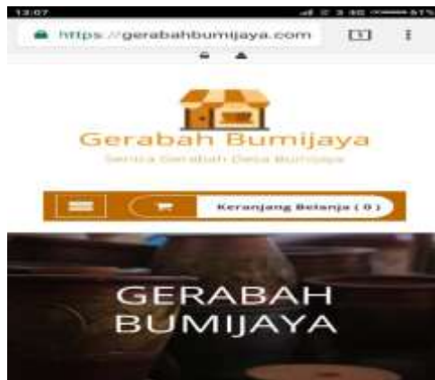
Gambar 5. Antarmuka website

Jika ditelusur di internet, eksistensi aktivitas membuat gerabah tetap ada. Bisa jadi sekarang tiap pengrajin sudah menjual secara mandiri. Adapun pengabdian kami tahun 2018, hanya memantik penggunaan youtube, instagram, dan Whatsapp. Namun masalah pengrajin yang membutuhkan bantuan tetap selalu ada. (Banten Pos, 2023).